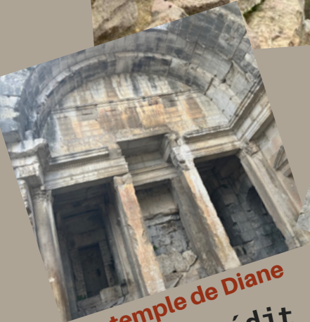
Le temple de Diane